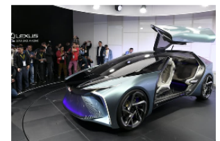
レクサスの「LF-30」(23日、東京都江