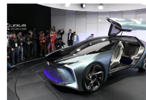
レクサスの「LF-30」(23日、東京都江